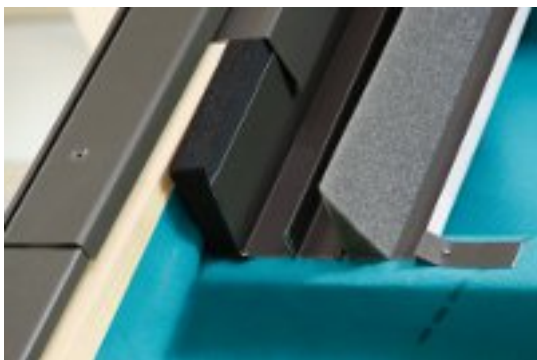
Przekrój kołnierza z materiałem docieplającym

Przeznaczony do wszystkich okien dachowych zarówno drewnianych jak i aluminiowo-tworzywowych. Kołnierz Thermo standardowo przystosowany jest do montażu pojedynczego okna w połaci dachu. Występuje również w wersji modułowej do zespalandia okien w poziomie, pionie oraz blokowo. Montowany jest na głębokości V (0), a zakres montażu wynosi od 15° do 90°.